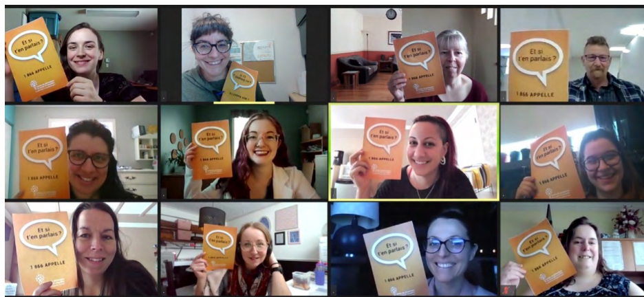
Photo prise le 2 février 2022 dans le cadre de la SPS.